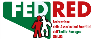
Tavola Rotonda - programma preliminare